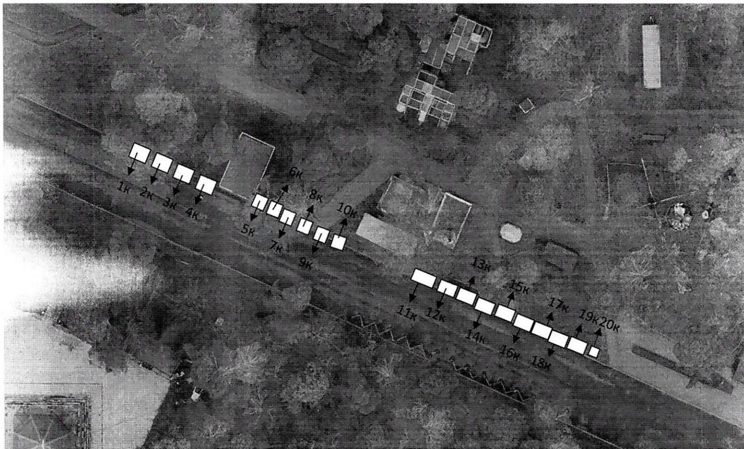
Схема расположения мест для продажи товаров (выполнения работ, оказания услуг) на универсальной ярмарке на территории особо охраняемой природной территории регионального значения туристско-рекреационной местности парк «Берендеевка» в городе Костроме